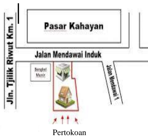
Gambar 2. Lokasi penelitian